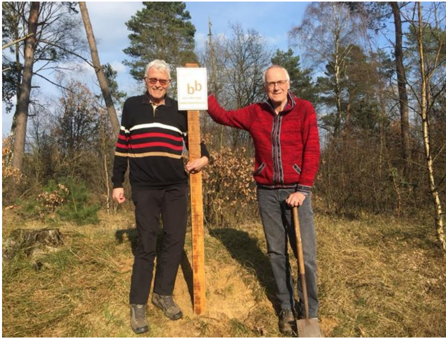
Het plaatsen van de bordjes in ons bos door twee bestuursleden

Toen we als stichting van start gingen dachten we aan de koop van een bos in Zweden. Evenwel de Zweedse wet en het beleid aldaar stonden een aankoop in de weg. Vandaar dat we in Nederland zijn gaan zoeken en eind 2017 een bos van 4.5 ha in de gemeente Cranendonck vonden vlak bij de grens met België. Om onze naamsbekendheid te vergroten hebben we bordjes met onze naam en website in de rand van het bos geplant.