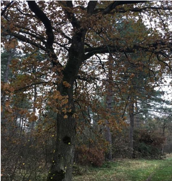
Winterbeeld van het bos vanaf de oostelijk gelegen akkers.

qua CO2 opslag de beste aanpak is. We willen planmatig met het beheer omgaan. Recent hebben studenten van de Hogeschool Larenstein uit Velp een “beheerplan/werkplan” opgesteld. In dit plan geven ze aan hoe een CO2 bos te beheren en hoe de opslag van CO2 te monitoren. Dit plan is op de website in te zien.