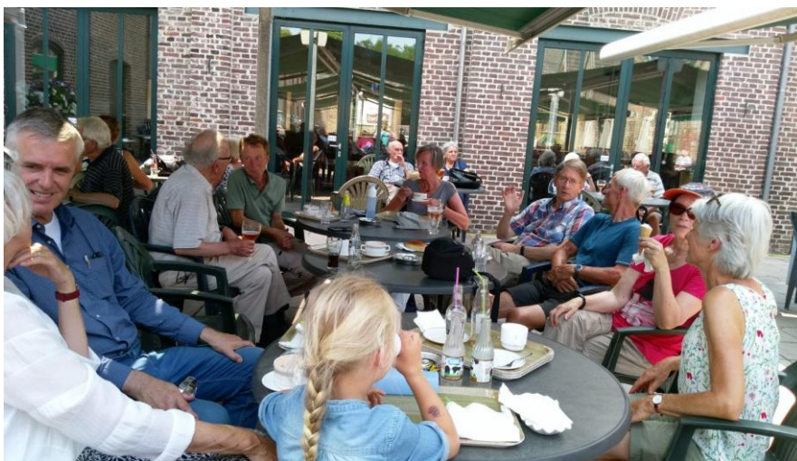
De nazit van de donateursdag in najaar 2018

De jaarlijkse donateursdag wordt door de bezoekers erg gewaardeerd. Deze dagen zullen worden gecontinueerd.