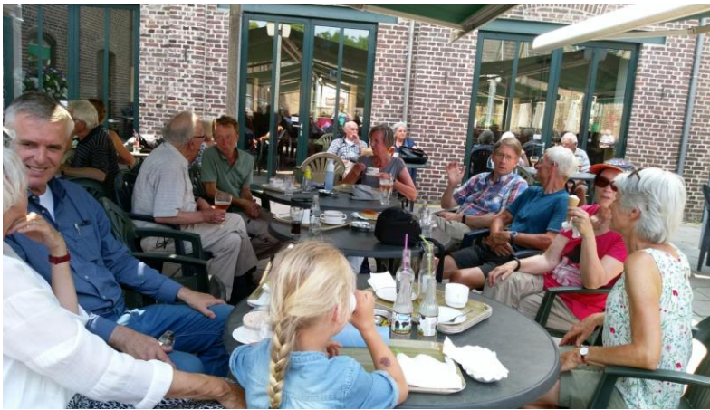
De nazit van een donateur dag

Ook zijn we gestart met specifieke excursies zoals het lopen van de uitgezette wandeling of een begeleid bezoek aan de Achelse Kluis.