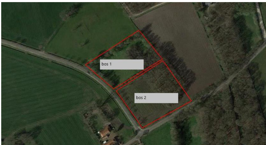
Het Keunenhoek bos 1 en 2