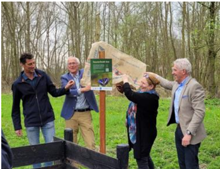
Onthulling info bord bij Keunenhoek