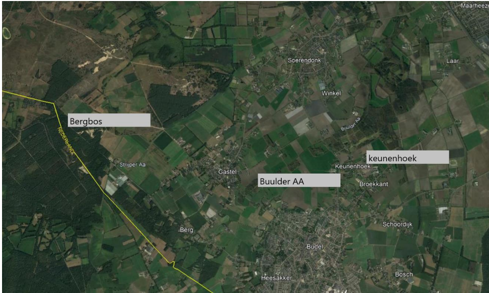
Kaart met drie aankoopgebieden