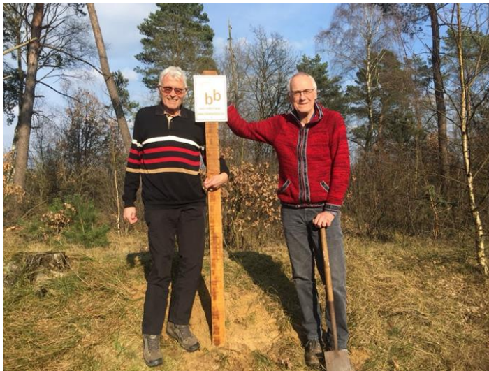
Info bord bij Bergbos

Bij speciale events zoeken we bewust de publiciteit zoals bij de onthulling van het informatie bord bij Keunenhoek.